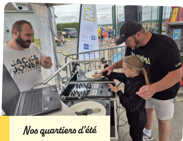
Nos quartiers d'été