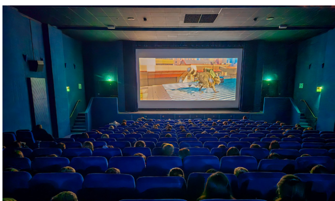
Séances cinéma offertes aux élèves des écoles élémentaires