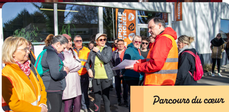
Parcours du cœur