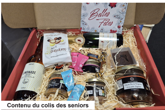
Contenu du colis des seniors