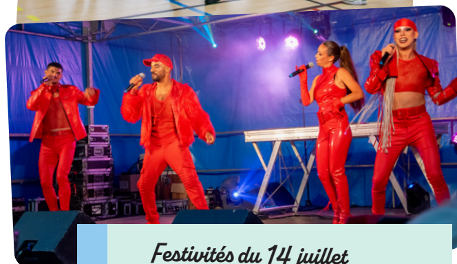
Festivités du 14 juillet