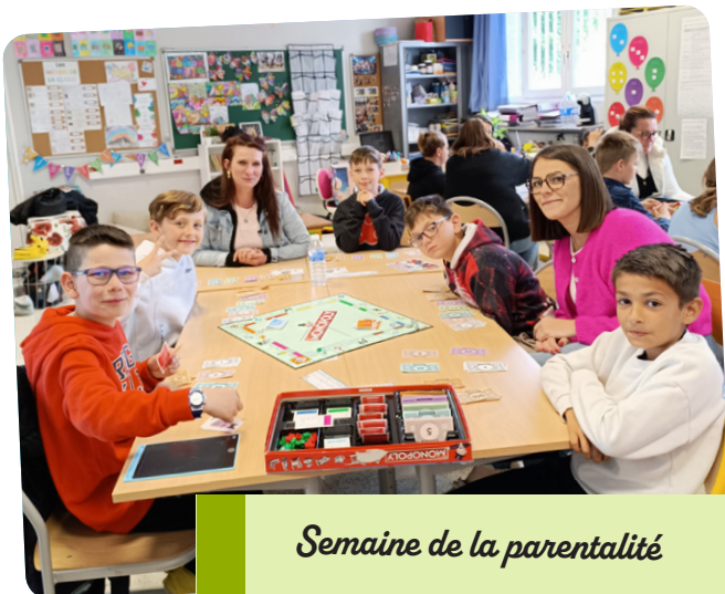
Semaine de la parentalité