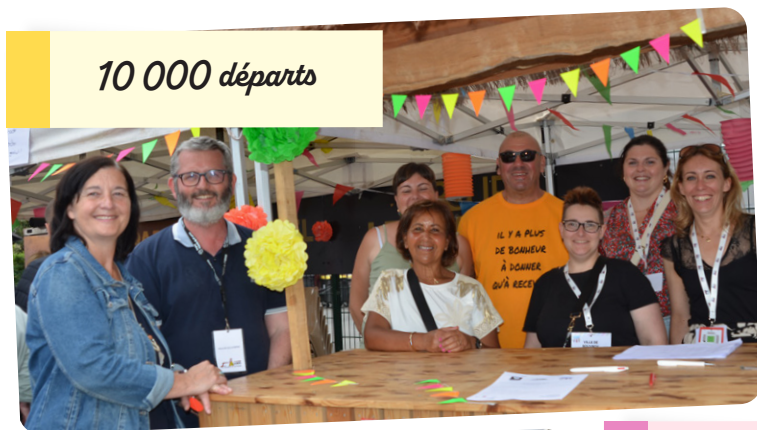
10 000 départs