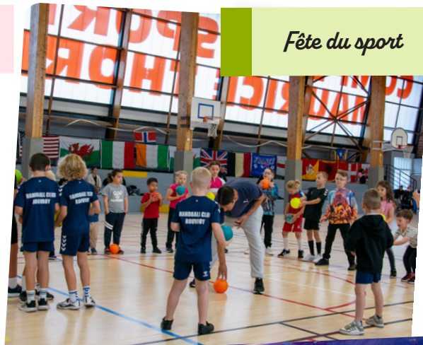
Fête du sport