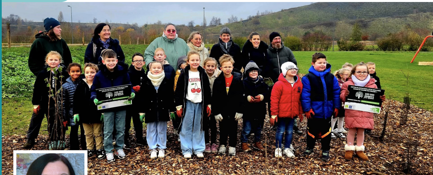
Plantations au Parc des îles par les élèves de CE2 de l'école Vaillant Couturier dans le cadre du projet " 100 000 arbres pour demain".