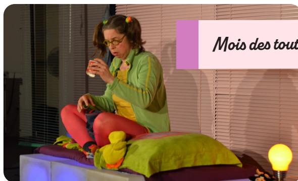
Mois des tout-petits