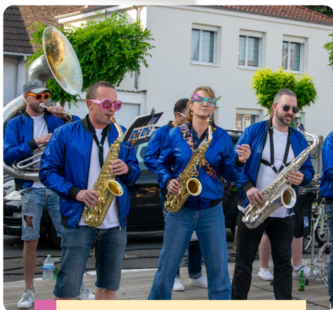
Marchés semi-nocturnes estivaux