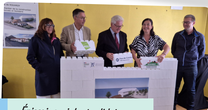
Épicerie sociale et solidaire