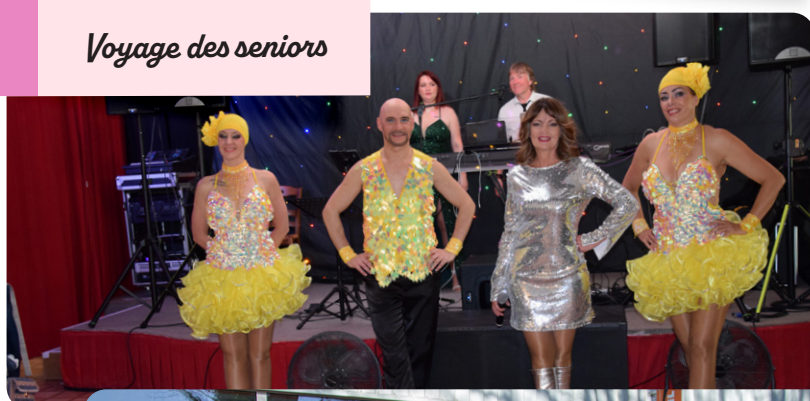
Voyage des seniors