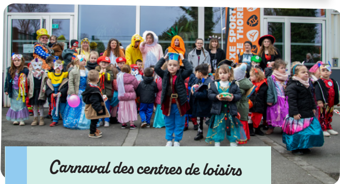
Carnaval des centres de loisirs