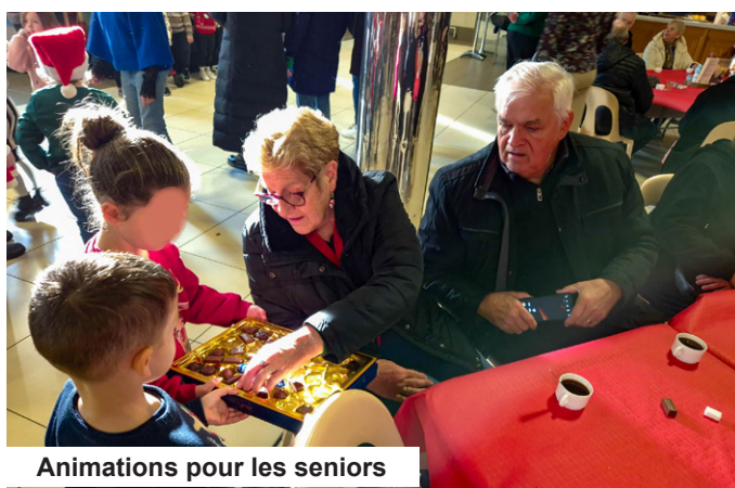
Animations pour les seniors