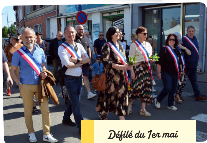
Défilé du 1er mai