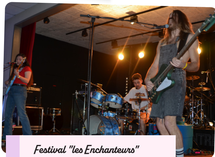
Festival "les Enchanteurs"