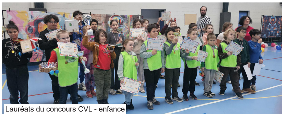
Lauréats du concours CVL - enfance

Lors du stage de découverte organisé avec Planète sciences, le CVL du mercredi a remporté deux coupes : celle du robot qui respectait le thème "paysage du monde" et celle des meilleurs supporters.