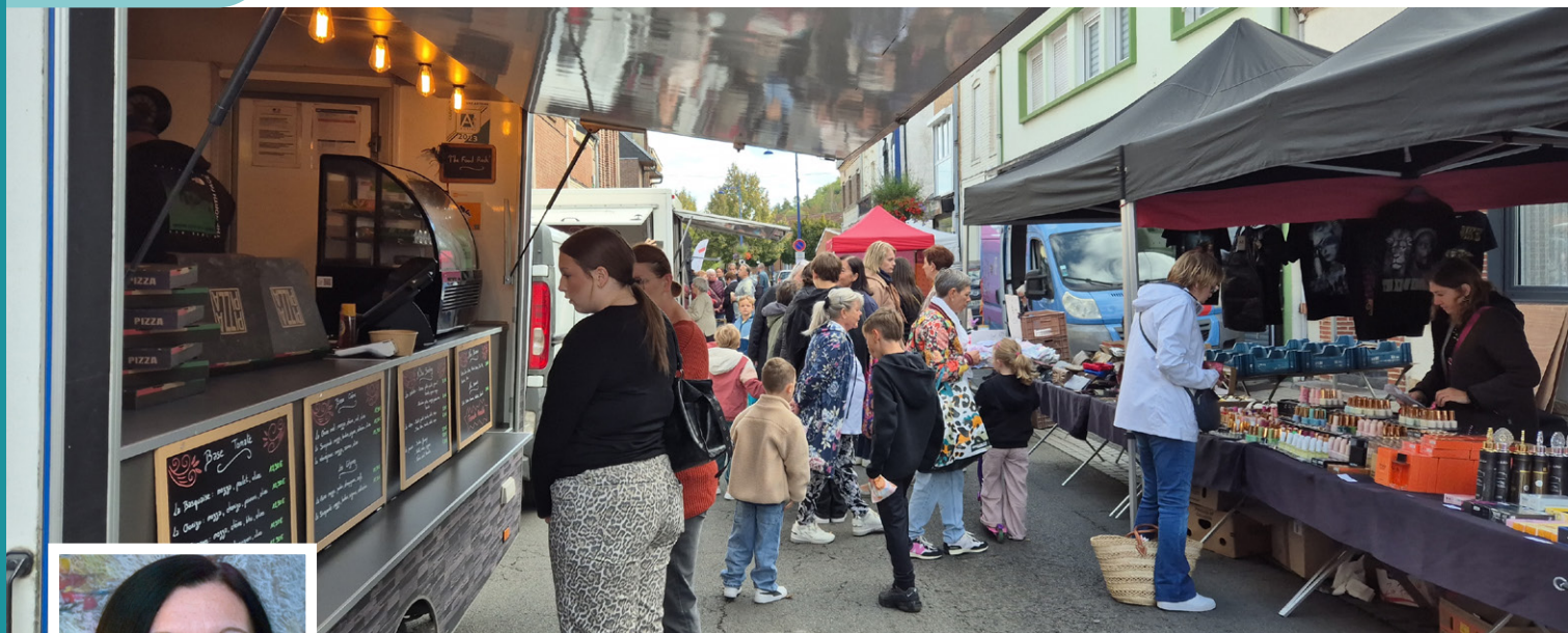
Le marché du samedi, un moment convivial pour se retrouver.