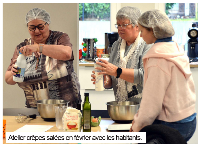
Atelier crêpes salées en février avec les habitants.

L'idée de cuisiner des aliments à faible apport en calories et peu coûteux attise votre curiosité ? Ça tombe bien ! Des séances animées par une diététicienne sont organisées par Filiéris et les partenaires associés, à la maison solidaire. Réservations au 03 21 74 82 41.