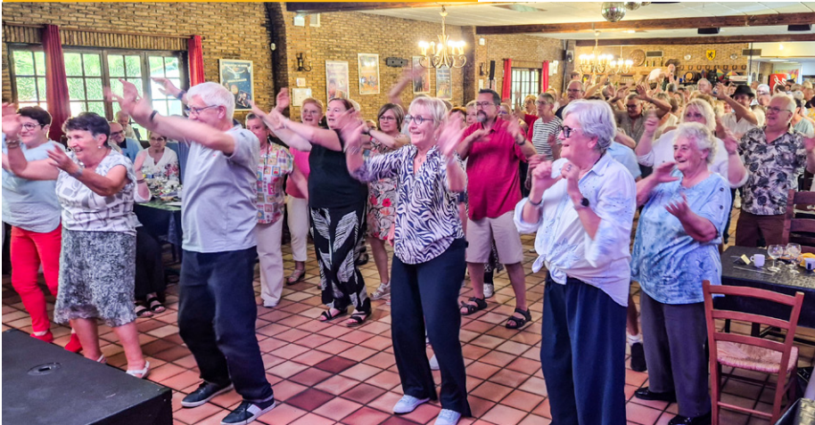
Voyage des seniors 2025