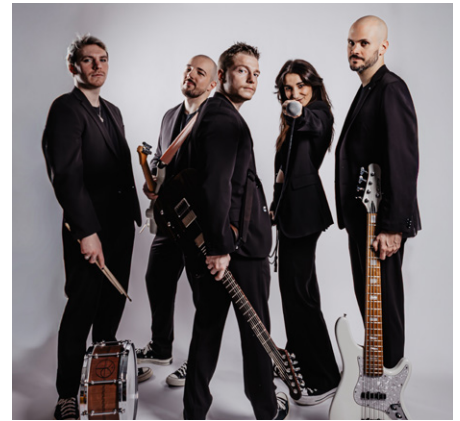
Groupe de musique North Fiction

Des soirées conviviales nous attendent de 18h à 21h30 avec comme de coutume des stands de produits artisanaux, d'idées cadeaux, de produits de beauté et bijoux. Sans oublier les animations musicales à savourer autour d'une boisson rafraîchissante et d'un plat préparé par nos food-trucks.