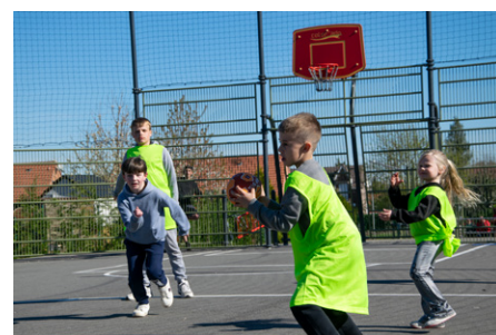
Atelier multisports au Languedoc