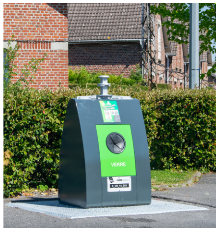
Point d'apports volontaires en verre

Vous pouvez faire appel aux services de la Communauté d'Agglomération Hénin-Carvin pour collecter vos objets volumineux ré-employables. Contactez la Direction Collecte et Valorisation des déchets au numéro vert 0800 31 32 49, du lundi au vendredi, de 8h30 à 12h et de 14h à 17h.