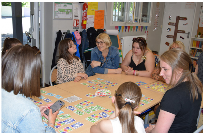
Après-midi récréative à l'école P. Vaillant Couturier