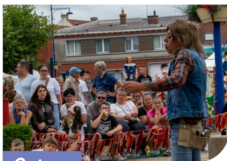
Culture Les Artoizes P.05