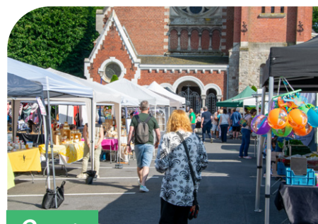
Sortie Marchés estivaux P.05