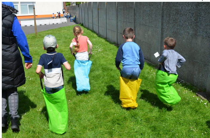
Défis sportifs à l'école D. Casanova