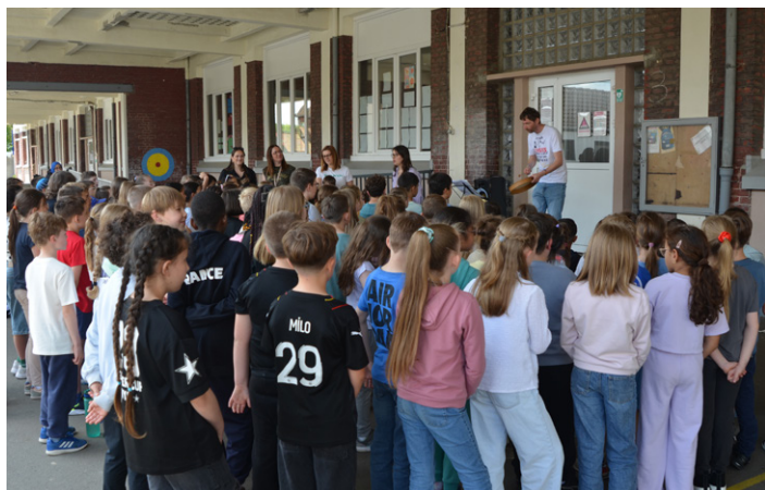
Chorale à l'école R. Briquet