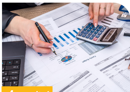
Actualité Budget communal 2026 P.08