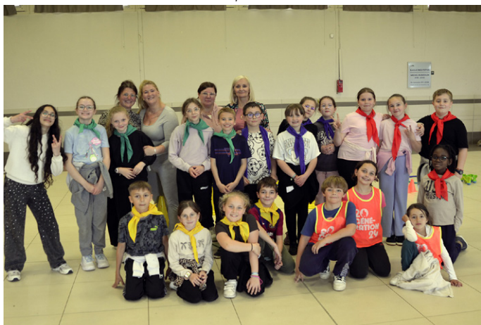
Olympiades de l'école Ferry Brossolette