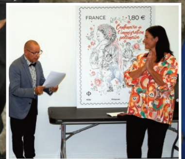
Philatélie, page 11