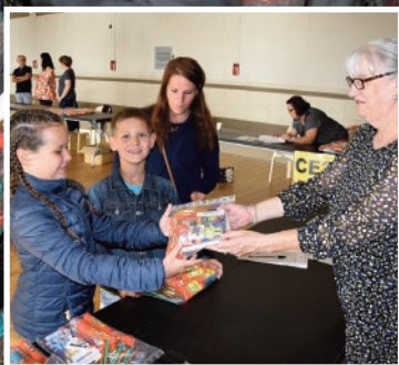
Rentrée scolaire, pages 4 et 5

Une rentrée scolaire, sous un soleil radieux !