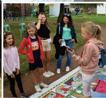
Rouvroy Montagne, page 6