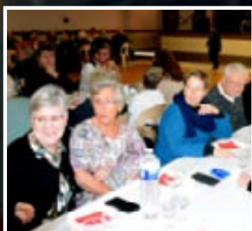
Goûter de la Sainte Barbe page 10