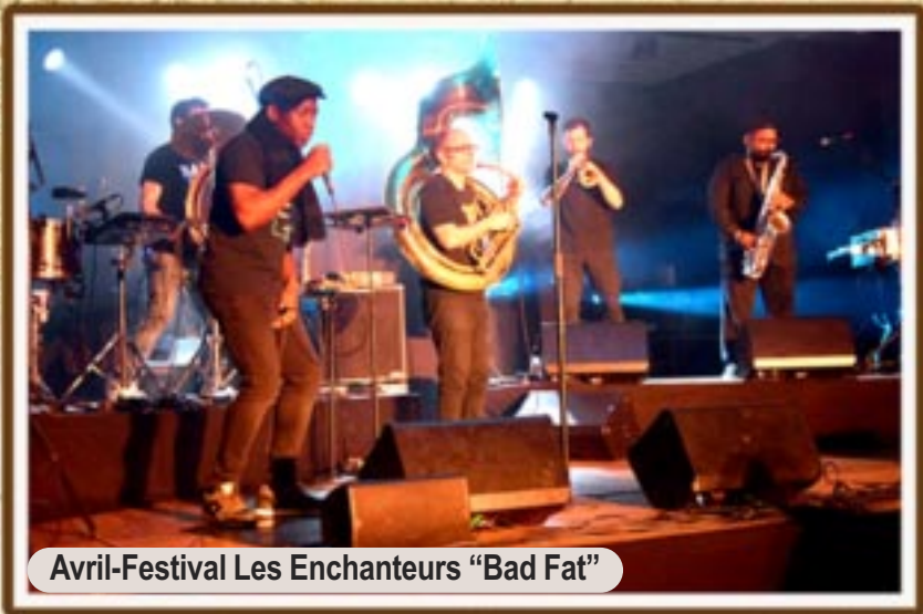
Avril-Festival Les Enchanteurs "Bad Fat"