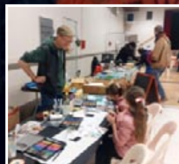
Festival de l'arbre page 12