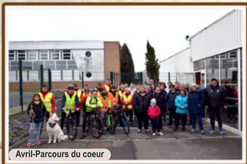
Avril-Parcours du coeur