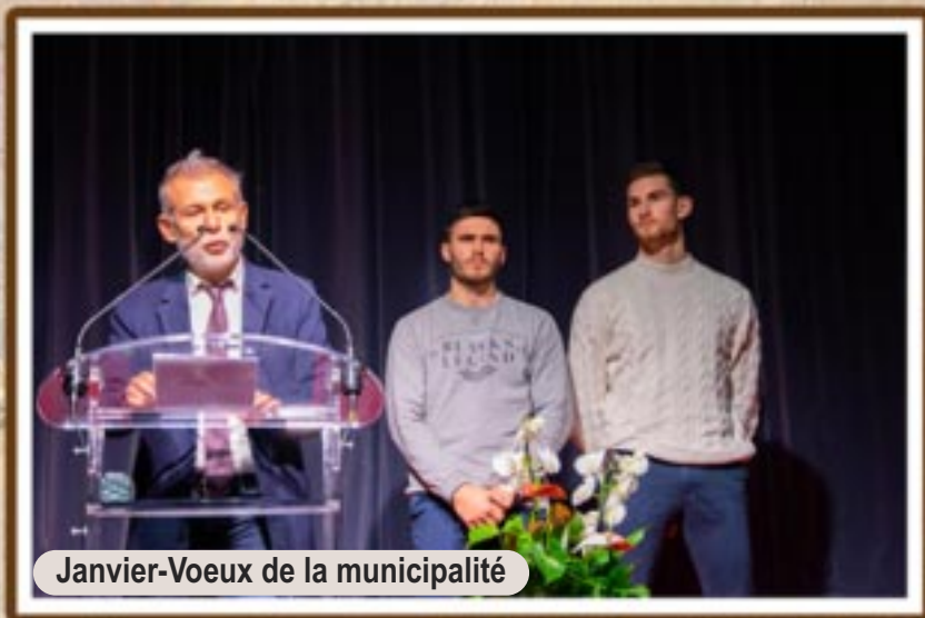
Janvier-Voeux de la municipalité