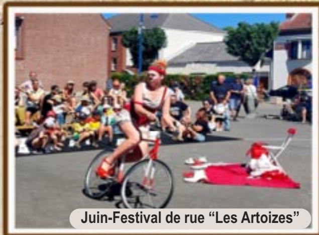
Juin-Festival de rue "Les Artoizes"