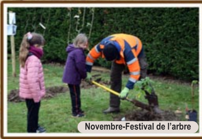
Novembre-Festival de l'arbre