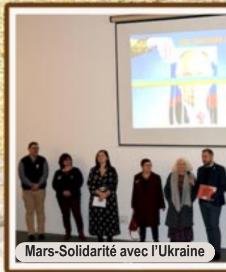
Mars-Solidarité avec l'Ukraine