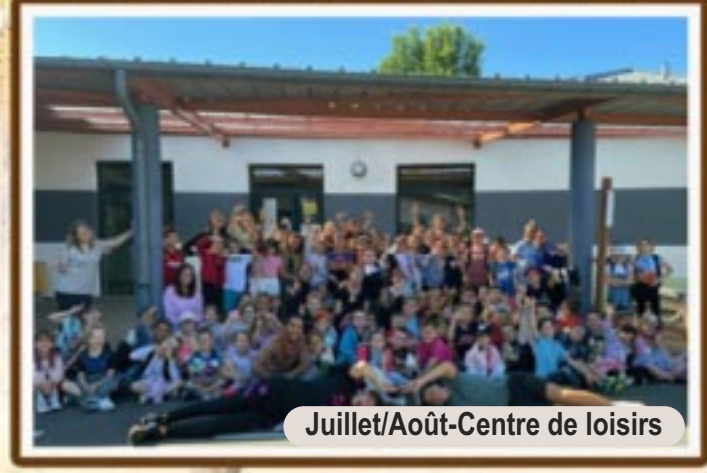
Juillet/Août-Centre de loisirs