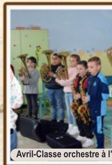
Avril-Classe orchestre à l'