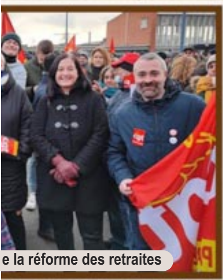
la réforme des retraites