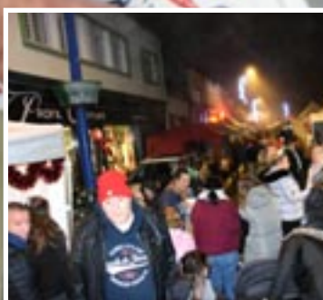
Marché semi-nocturne page 11