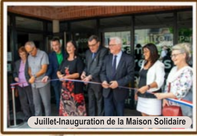
Juillet-Inauguration de la Maison Solidaire