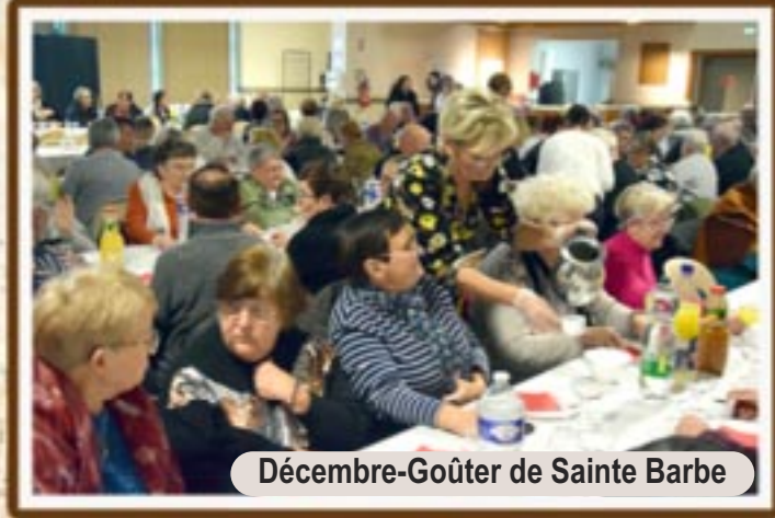
Décembre-Goûter de Sainte Barbe