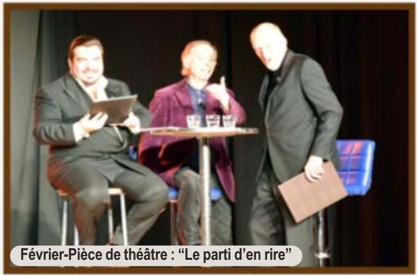
Février-Pièce de théâtre : "Le parti d'en rire"