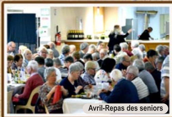
Avril-Repas des seniors