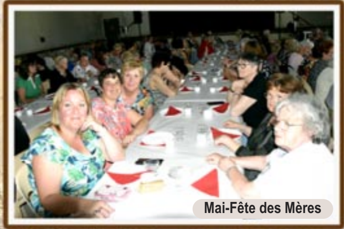
Mai-Fête des Mères