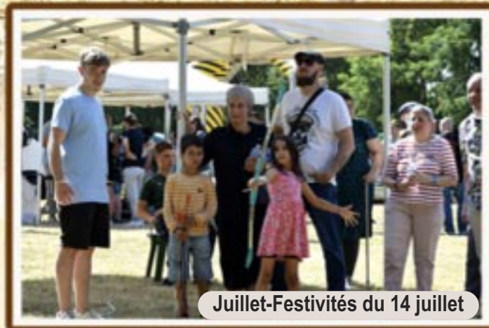
Juillet-Festivités du 14 juillet